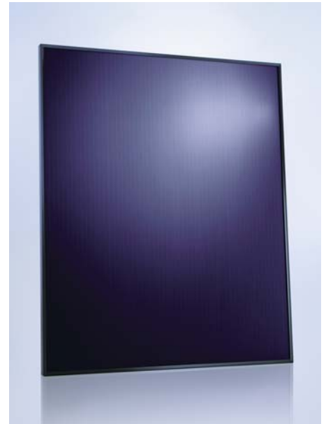
SCHOTT ASI® 87/90/95/100